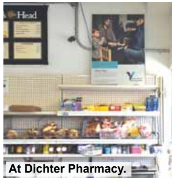
At Dichter Pharmacy.

To view the work of Yael Ben-Zion, go to www.yaelbenzion.com/photography .