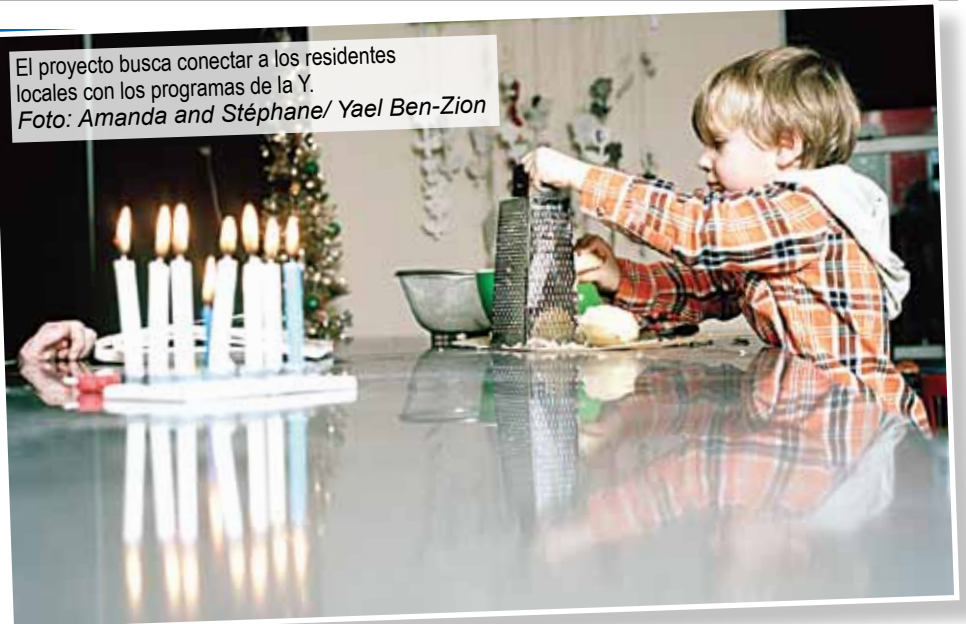
El proyecto busca conectar a los residentes locales con los programas de la Y.

tendrá lugar en la Y del 7 al 14 de junio y estará abierta al público en general.