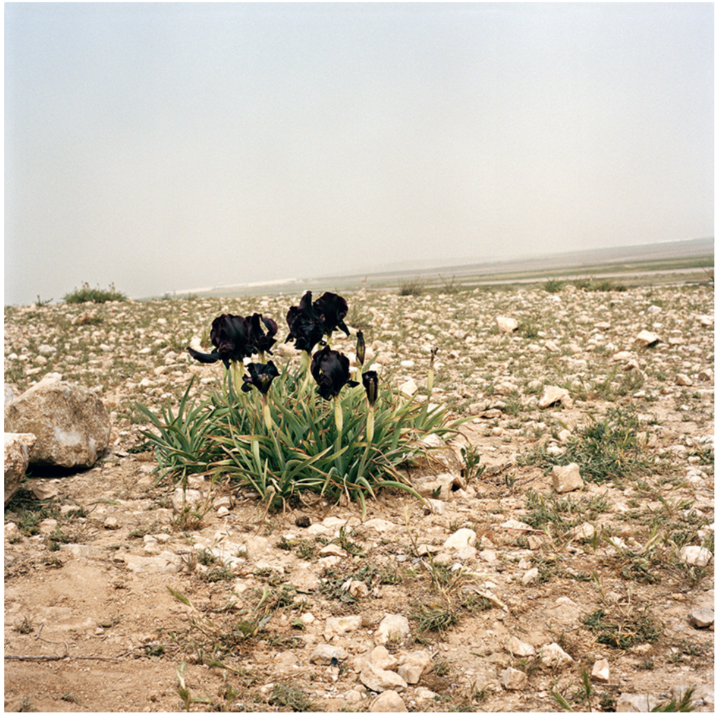
איריס שחור, 2004