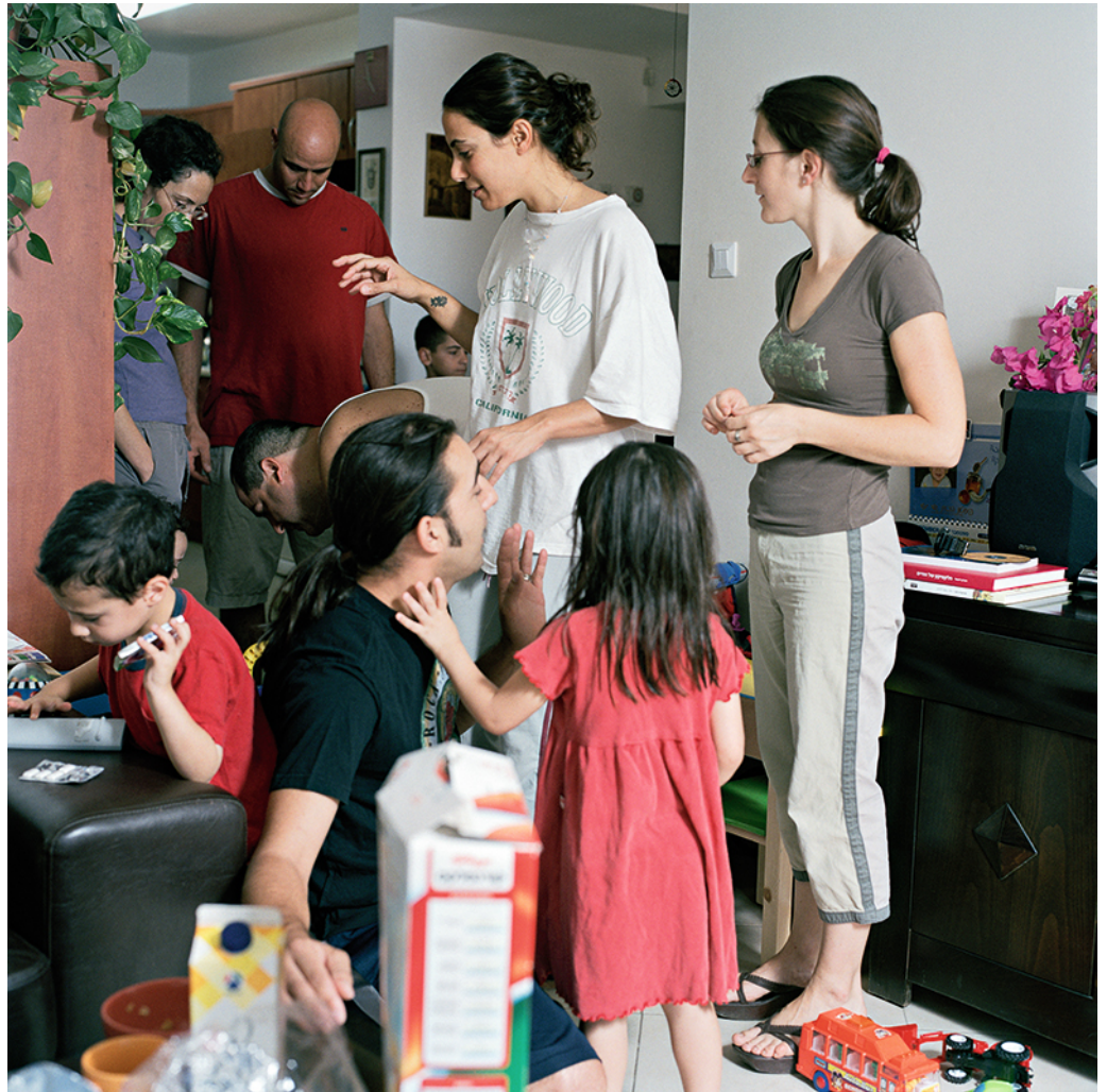
בוקר, ערב יום כיפור, 2007

ספציפי לסכסוך. קיר זמני של אתר בניה במקום שבו יוקם גן-משחקים מזכיר את גדר ההפרדה השנויה-במחלוקת. תחתונים לבנים התלויים על חבל מנומרים בצלליות אטבי כביסה. מצמץ והאטבים האלה הופכים לגדר-תיל.