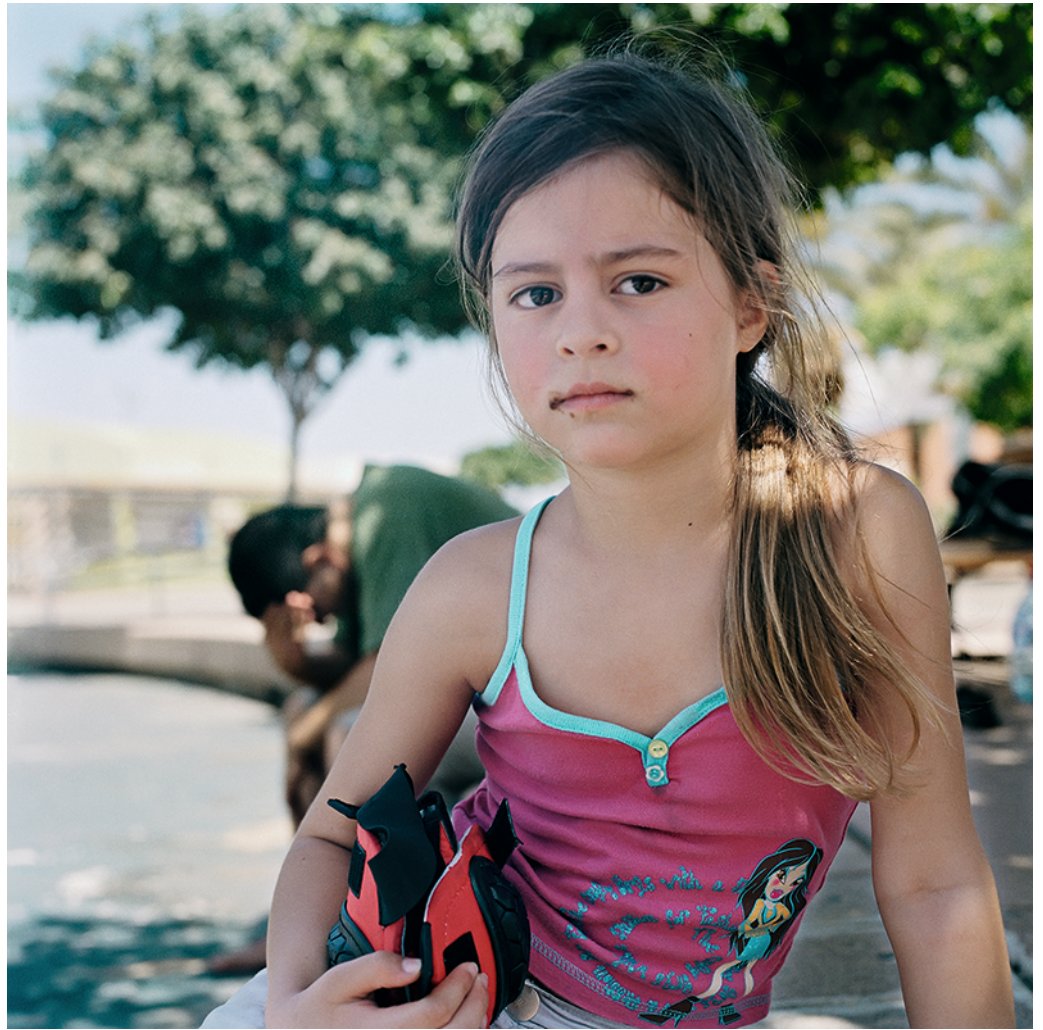
אלה עם ציוד מגן, 2008

יש מסע משתמע בספירת המיילים שהיא מדגישה בכותרת המדוייקת, 5683 מיילים משם. זה המרחק שבין נמל התעופה בן גוריון בתל אביב לבין נמל התעופה ג'ון פ' קנדי בניו יורק, המרחק הפיזי אותו עברה מחייה הקודמים בישראל אל חייה בארה"ב, שהחלו בלימודים בניו הייבן – וכיום מרוכזים בניו יורק. במהלך עשר השנים האחרונות היא עברה את מספר המיילים הזה בדרכה הביתה לבקר, ובתחושת תכלית גוברת – כדי ליצור את התצלומים האלה.