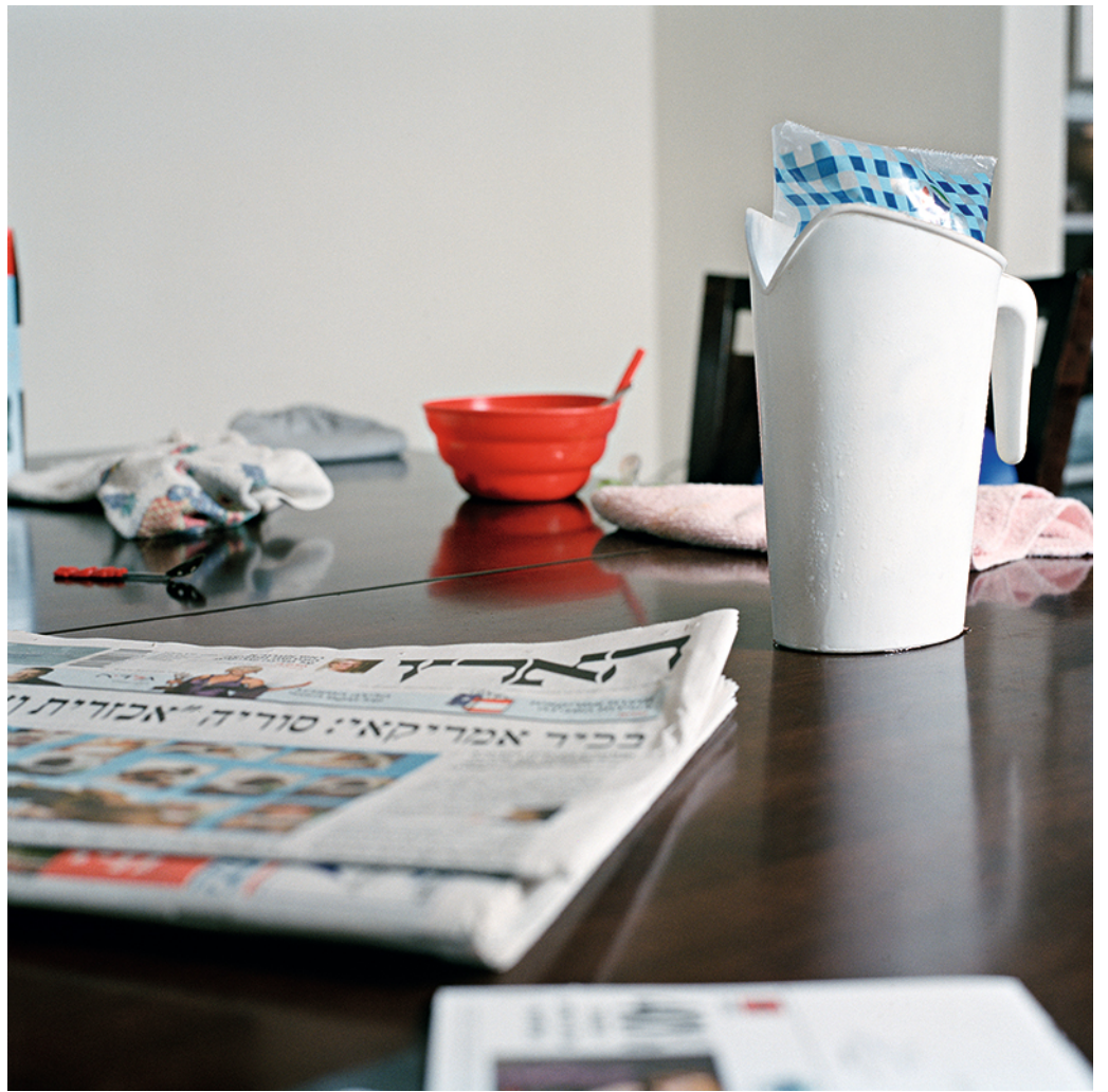
חלב, 2007