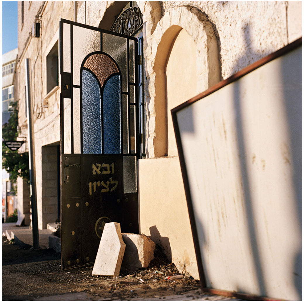
ובא לציון... 2007